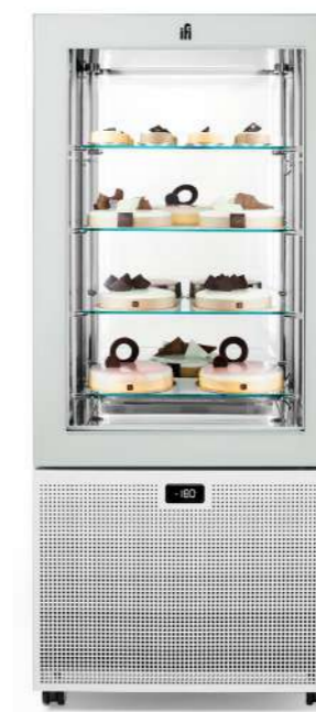
Pivot H 1550 mm