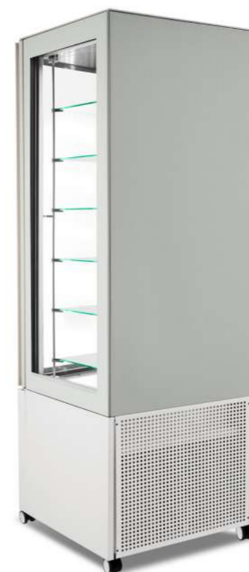
Pivot 3 lati Pivot de 3 lados