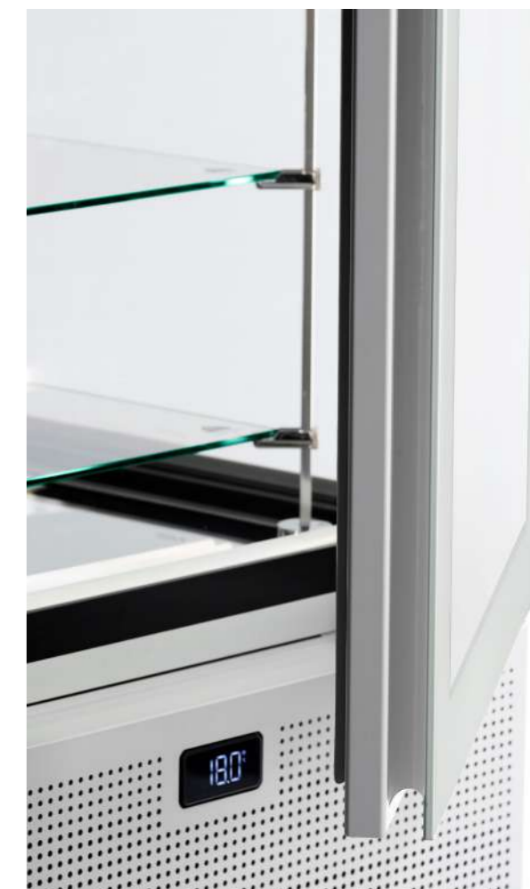
Maniglia integrata e display elettronico full touch Asa integrada y pantalla electrónica táctil

Con Pivot puede decir adiós a la condensación: el doble acristalamiento calefactado en cada lado, siempre eficaz incluso cuando se colocan uno al lado del otro o en un escaparate, ofrece la máxima visibilidad; el sistema anticondensación de la puerta elimina el empañamiento tras la apertura. Las creaciones expuestas destacan excepcionalmente gracias a los estantes de nuevo diseño y se ven realzadas por una iluminación difusa y rasante gracias a 3 barras LED incorporadas en la estructura. En la versión ventilada (H 1900 mm), los 6 niveles de exposición permiten aprovechar al máximo el espacio gracias al evaporador integrado en la base, lo que resulta en una exposición aún más amplia y sin barreras, para una limpieza formal que hace de Pivot un objeto de diseño único.