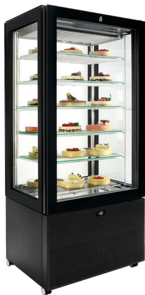
Pivot statico H 1900 mm Pivot estatico H 1900 mm